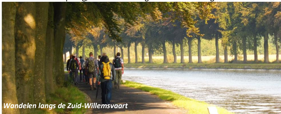
Wandelen langs de Zuid-Willemsvaart

Wie wil kan om 08.30 uur de eucharistie meevieren in de naast het hotel gelegen St.-Michielskerk. Via de Zuid-Willemsvaart en Bocholt bereiken we Priorij Klaarland van de trappistinnen en nemen deel aan een korte dienst. Na de picknickpauze aldaar gaan we via Hamont en de Warmbeek naar Achel-Statie en logeren in Hotel De Zevensprong, vlak voor de Belgisch-Nederlandse grens.