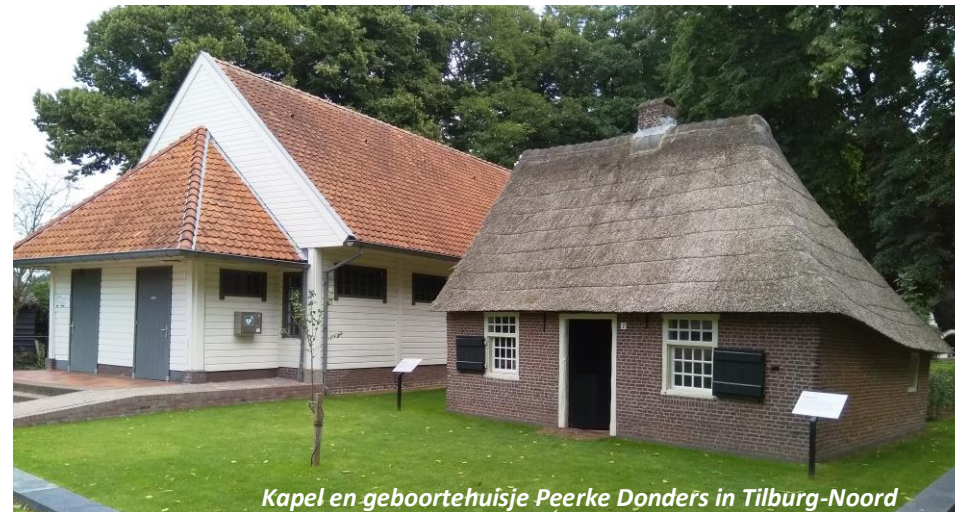
Kapel en geboortehuisje Peerke Donders in Tilburg-Noord

Langs vennen en door bossen en door Berkel-Enschot wandelen aan de noordkant Tilburg binnen. We sluiten de pelgrimstocht af in de Peerke Donderskapel en bezoeken nog zijn geboortehuisje en het Peerkepaviljoen, museum van naastenliefde. Met een lunch in restaurant 'Bij Peerke' nemen we afscheid van elkaar.